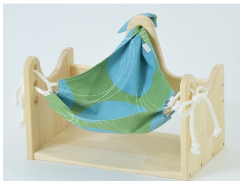
ハンモックピロー