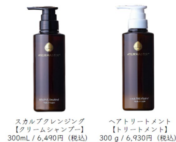
シャンプー・コンディショナー